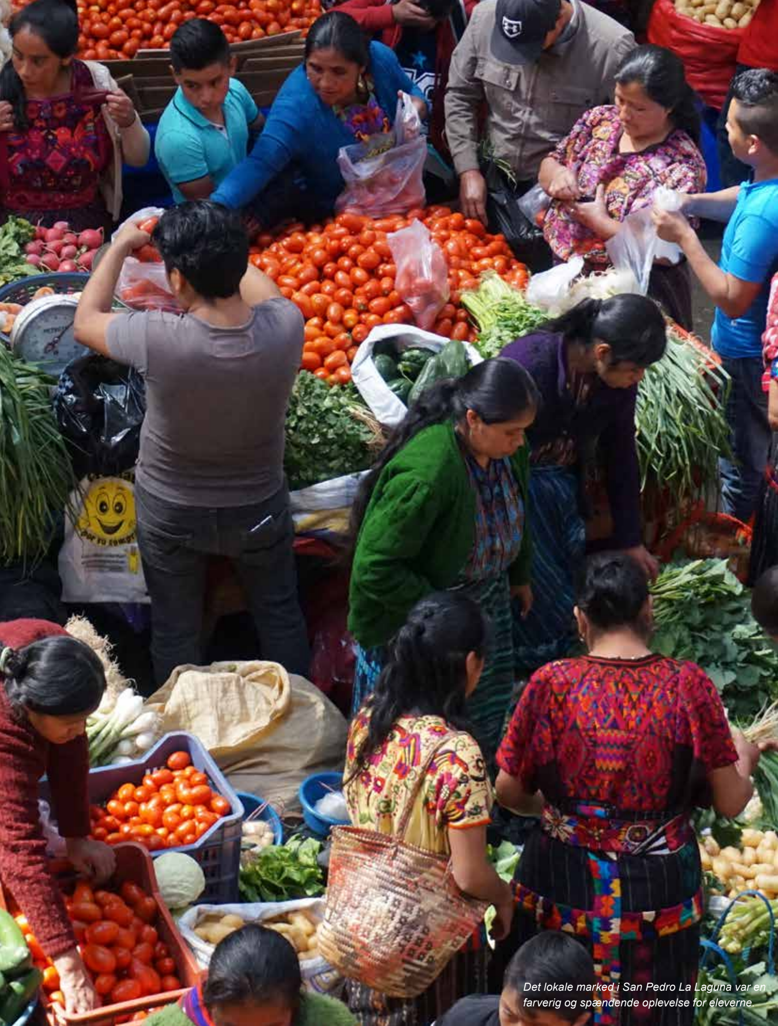
Det lokale marked i San Pedro La Laguna var en farverig og spændende oplevelse for eleverne.