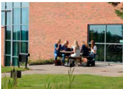
Fællesskabet betyder meget for eleverne.

Men den almindelige forståelse, sådan som jeg hører det fra bekendte, er, at Silkeborg Gymnasium er et godt sted at være.”