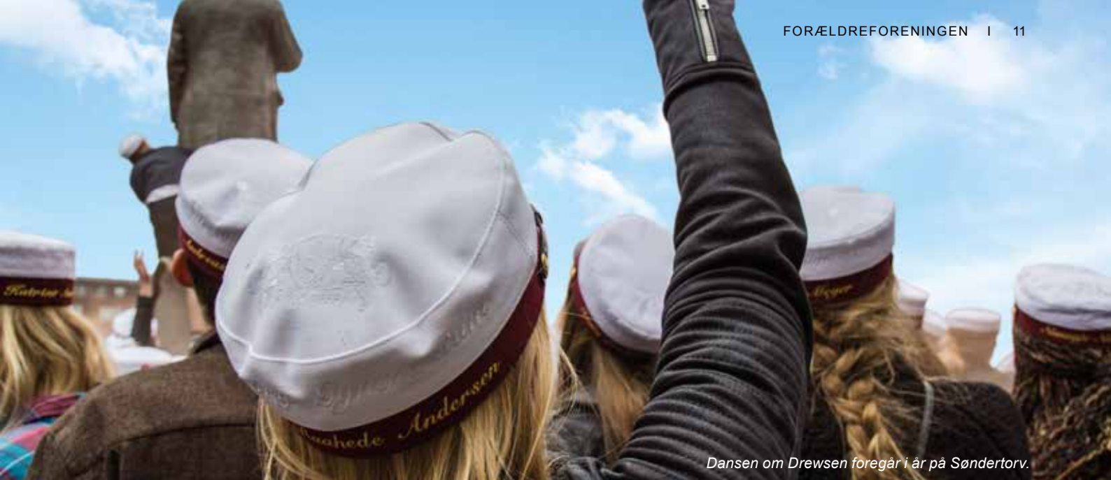
Dansen om Drewsen foregår i år på Søndertorv.