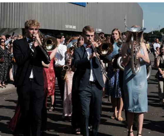
3.d ankom til lanciers for fuld udblæsning

Vi har netop oplevet dem til lanciers i en propfyldt arena – på én gang stilfulde og afslappede, alvorlige og humørfyldte. Mange af dem lidt nervøse før indmarchen, indtil de slår sig løs i dansen og afslutningsvis fjoller rundt til The Final Countdown.