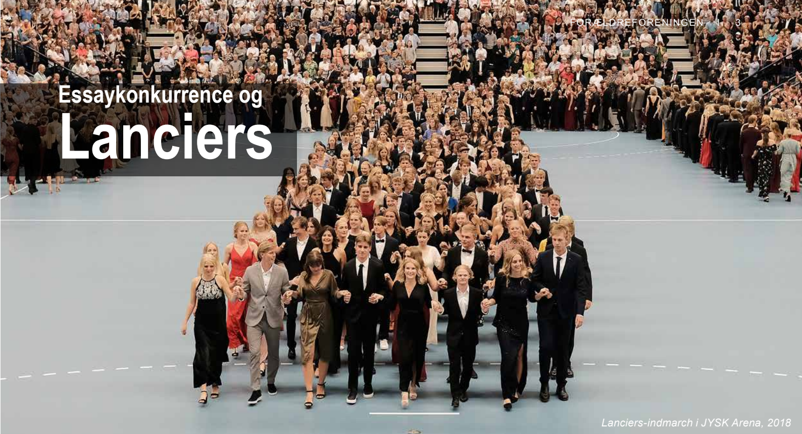
Lanciers-indmarch i JYSK Arena, 2018